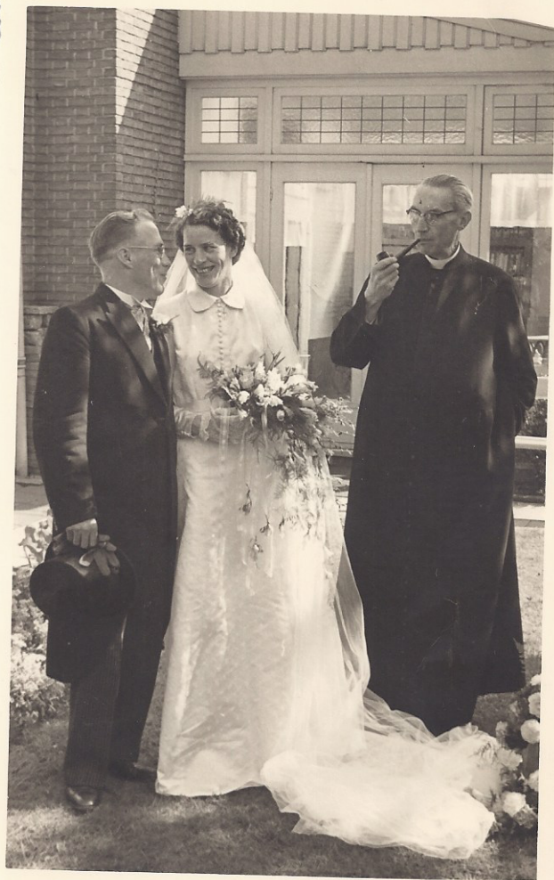
Vel - Herman . Gastoor Kwelman !