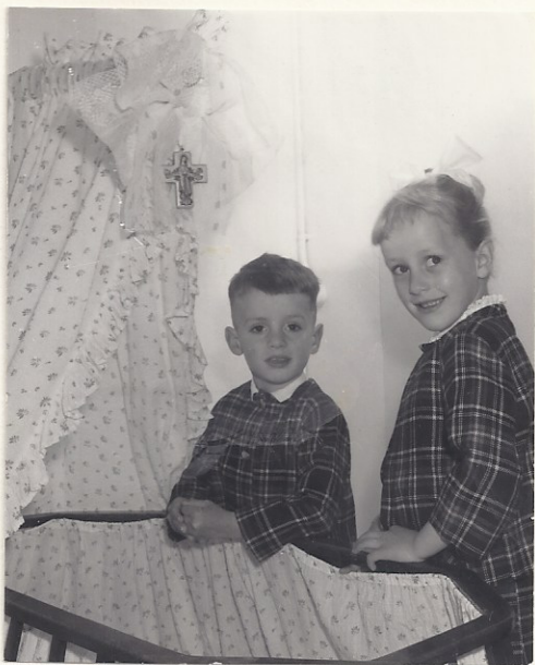
Hier is ons broertje